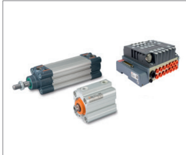
Zylinder und Ventilinseln