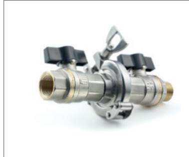
Kugelhähne via Clamp Verbindung trennbar