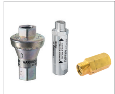
Druckreduzierventile für Luft und Sauerstoff