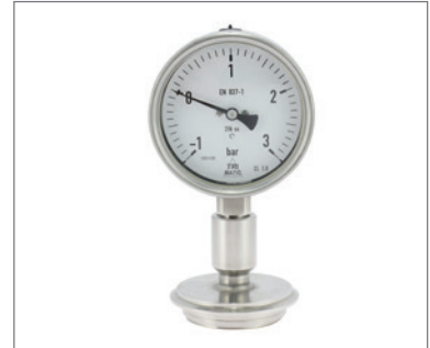
Druckmittler und Prozess-Anschlüsse