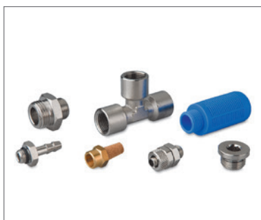
Fittings und Zubehör