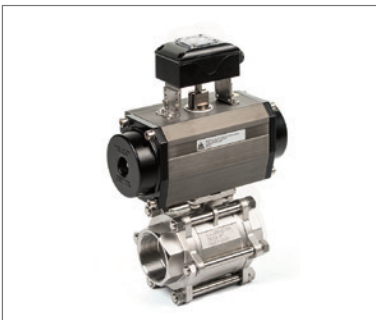
Antriebe mit Schaltboxen