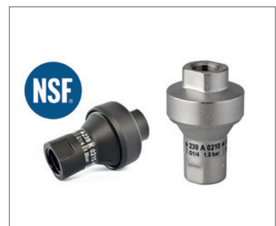
Druckreduzierventile für Wasser