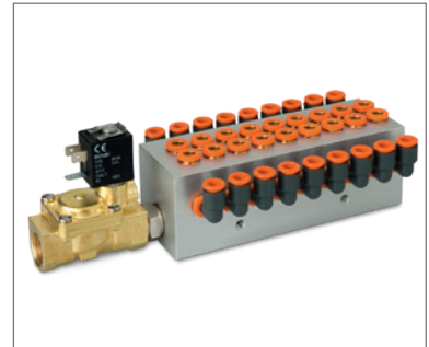
18-fach ODER Ventilbatterie