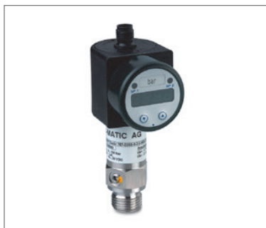
Sensoren mit Anzeige