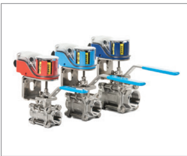
Kugelhähne mit Endschalbox